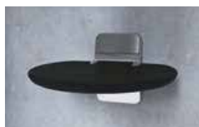
Finitura nera - sedile nero