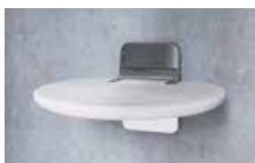
Finitura bianca - sedile bianco